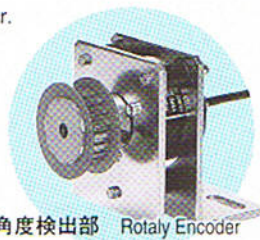
角度検出部 Rotaly Encoder